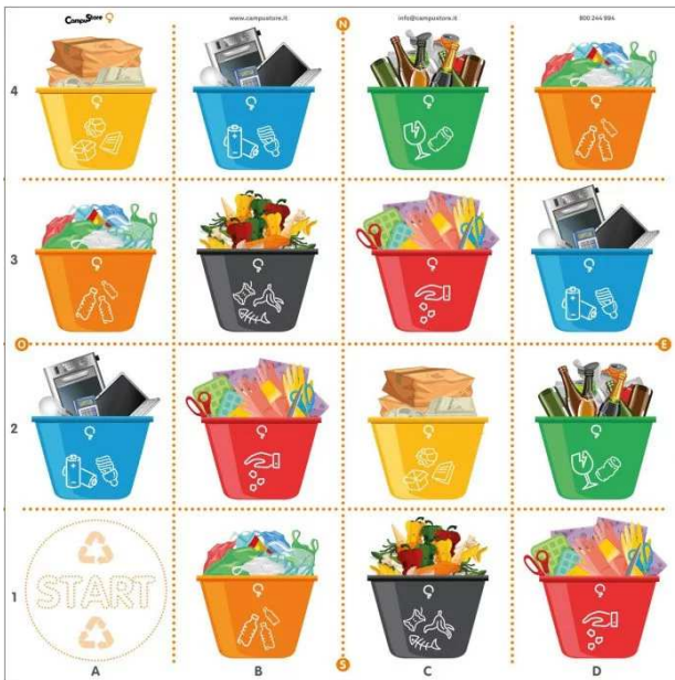
PERCORSO BEE BOT RACCOLTA DIFFERENZIATA