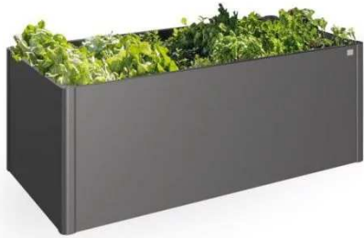
AIUOLA RIALZATA 2mX 1m acciaio zincato

n. 10 aiuola rialzata per il giardino della scuola secondaria di primo grado