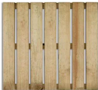
Mattonella zigrinata in legno 50x50x20,8h cm