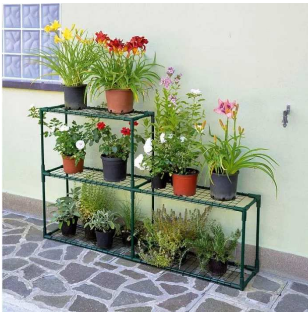
SCAFFALE a ripiani cm 142x30x h 98 o simili

n. 10 aiuola rialzata per il giardino della scuola secondaria di primo grado