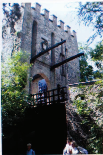
LO PONTE LEVATOIO...