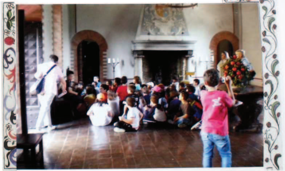
LA SALA CON GLI STEMMI!